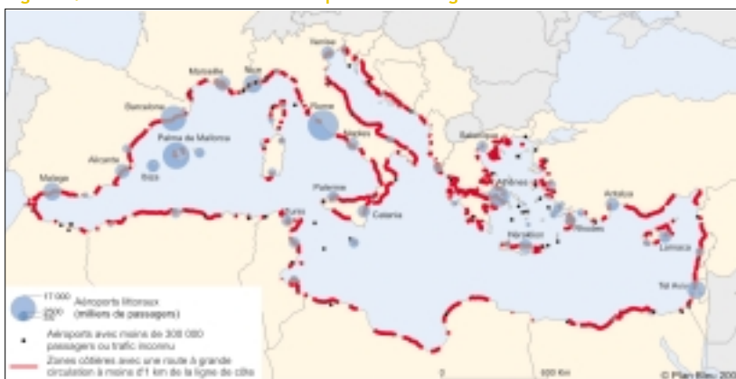
Figure 3 : Infrastructures routières et aéroportuaires le long du littoral