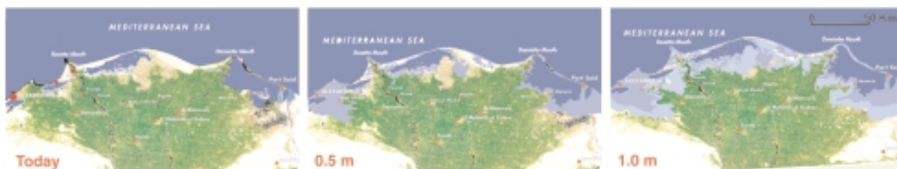
Figure 5 : Impacts potentiels de l'élévation du niveau de la mer sur le delta du Nil