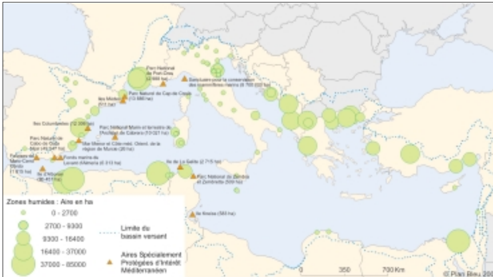
Figure 6 : Aires spécialement protégées d'intérêt méditerranéen (ASPIM) et zones humides désignées Ramsar