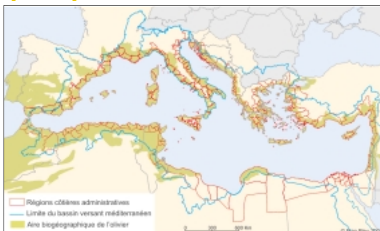
Figure 1 : Les régions littorales méditerranéennes

Le littoral méditerranéen compte 46 000 km de côtes, dont 42 % (19 000 km) appartenant aux nombreuses îles. En 2000, il rassemblait 143 millions d'habitants dans 234 unités administratives côtières (Figure 1). Autrement dit, 33% de la population méditerranéenne vit sur 13% de la superficie des pays riverains.